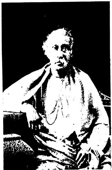
ডাক্তার শ্রীযুক্ত মহেন্দ্রলাল সরকার ।