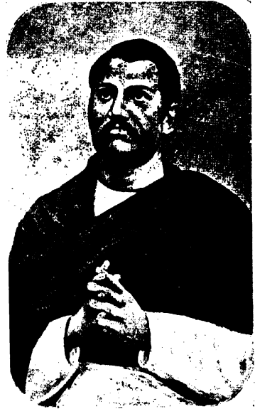
শ্রীযুক্ত কেশবচন্দ্র সেন ।