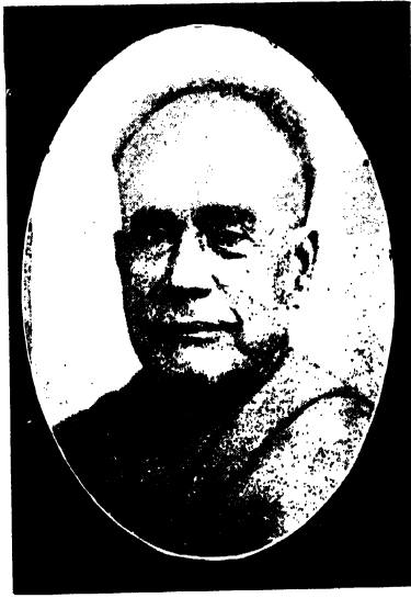
শ্রীযুক্ত ঈশ্বরচন্দ্র বিদ্যাসাগর ।